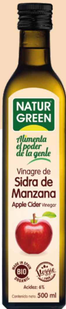
Vinagre de Sidra de manz. orgánico GF Naturgreen bot 500cc

Código de barras EAN: 8436542192682 Código interno: 7017 Origen: España Uní. x caja: 6 Tipo de IVA: 22%