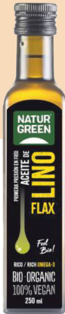
Aceite de Lino orgánico GF Naturgreen bot 250cc

Código de barras EAN: 8437011502209 Código interno: 7012 Origen: España Uní. x caja: 6 Tipo de IVA: 10%