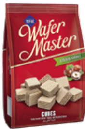
Cizmeçi Wafer Master Galleta de Avellanas 100gr

Código de barras EAN: Código interno: 6192 Origen: Turquía Uni. x caja: 36 Tipo de IVA: 22%