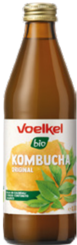
Kombucha orgánica GF Voelkel Original bot 330cc

Código de barras EAN: 4015533047763 Código interno: 8010 Origen: Alemania Uni. x caja: 6 Tipo de IVA: 22%