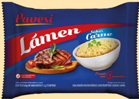
Pavesi Noodles Carne 63gr

Código de barras EAN: 7896010603088 Código interno: 6200 Origen: Brasil Unl. x caja: 60 Tipo de IVA: %22