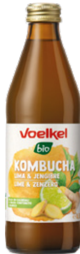
Kombucha orgánica GF Voelkel Limón y Jengibre bot 330cc

Código de barras EAN: 4015533047749 Código interno: 8011 Origen: Alemania Uni. x caja: 6 Tipo de IVA: 22%