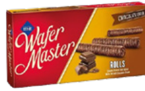
Cizmeçi Wafer Master Barquillos Chocolate 65gr

Código de barras EAN: Código interno: 6191 Origen: Turquía Uni. x caja: 24 Tipo de IVA: 22%