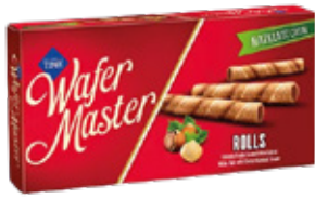
Cizmeçi Wafer Master Barquillos Avellanas 65gr

Código de barras EAN: Código interno: 6190 Origen: Turquía Uni. x caja: 24 Tipo de IVA: 22%