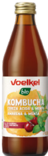
Kombucha orgánica GF Voelkel Cereza y menta bot 330cc

Código de barras EAN: 4015533052644 Código interno: 8012 Origen: Alemania Uni. x caja: 6 Tipo de IVA: 22%