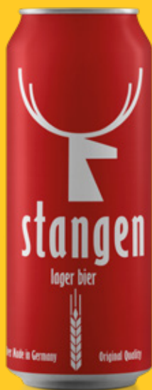
Cerveza premium lager Stangen lata 500cc

Código de barras EAN: 4260556080055 Código interno: 6153 Origen: Alemania Uni. x caja: 24 Tipo de IVA: 22%