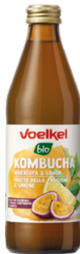
Kombucha orgánica GF Voelkel Maracuyá y limón bot 330cc

Código de barras EAN: 40155330559404 Código interno: 8014 Origen: Alemania Uni. x caja: 6 Tipo de IVA: 22%