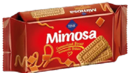
Cizmeçi Mimosa Galleta de Caramelo 128gr

Código de barras EAN: Código interno: 6194 Origen: Turquía Uni. x caja: 20 Tipo de IVA: 22%