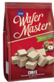
Cizmeçi Wafer Master Galleta de Chocolate 100gr

Código de barras EAN: Código interno: 6193 Origen: Turquía Uni. x caja: 36 Tipo de IVA: 22%