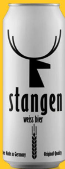
Cerveza premium Weiss Stangen lata 500cc

Código de barras EAN: 4260556080017 Código interno: 6157 Origen: Alemania Uni. x caja: 24 Tipo de IVA: 22%