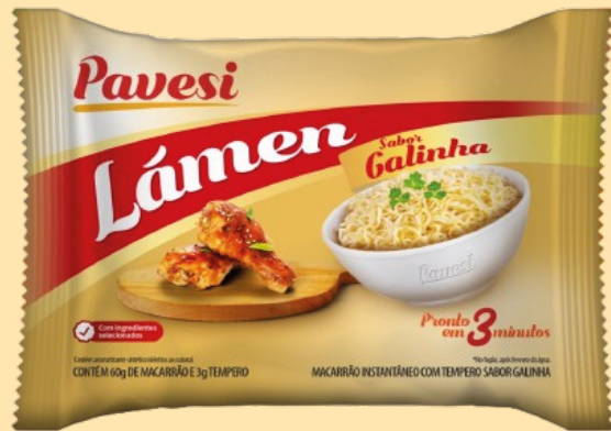
Pavesi Noodles Pollo 63gr

Pavesi Noodles llega para ofrecer la solución perfecta a quienes buscan una comida rápida sin sacrificar el sabor. Diseñados para un estilo de vida dinámico,